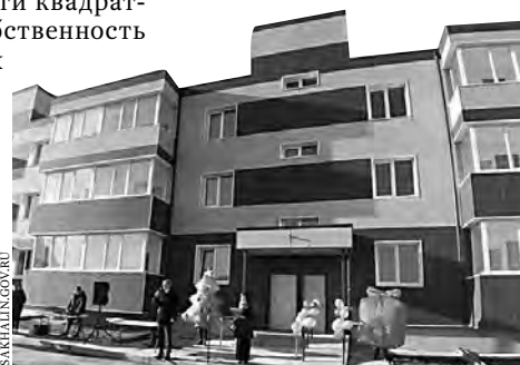
Трехэтажный арендный дом появился на улице Пограничной.