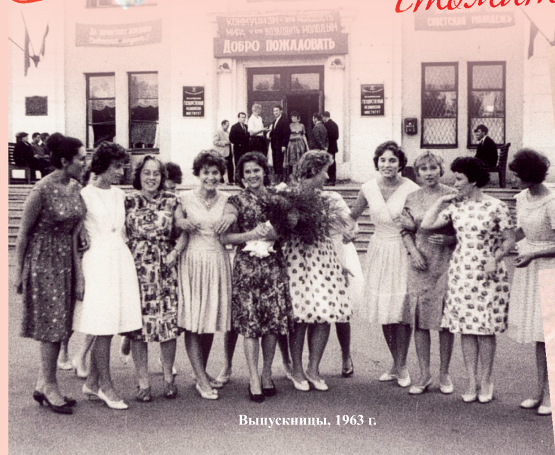
Выпускники, 1963 г.

50 лет первому выпуску стоматологического факультета