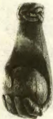
Обложка А. Обросковой