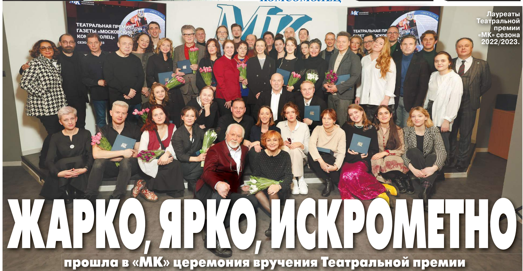
Лауреаты Театральной премии «МК» сезона 2022/2023.