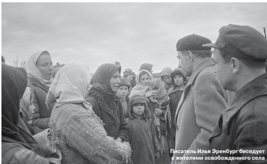
Писатель Илья Эренбург беседует с жителями освобожденного села