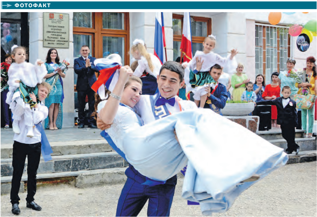
В школах Республики Крым последний звонок прозвенел для 17943 девятиклассников и 9902 одиннадцатиклассников. В понедельник последние начали сдавать Единый госэкзамен, который продлится до 2 июля.

КРЫМЧАНЕ теперь могут получить в электронном виде 11 государственных и муниципальных услуг на сайте gosuslugi82.ru . К ранее оказываемым добавилась информация о результатах ЕГЭ и выдача охотничьих билетов РФ единого образца, что актуально перед охотничьим сезоном. Уже популярна запись в детсады, на прием к врачу, выдача разрешений на установку рекламных конструкций и другие услуги.