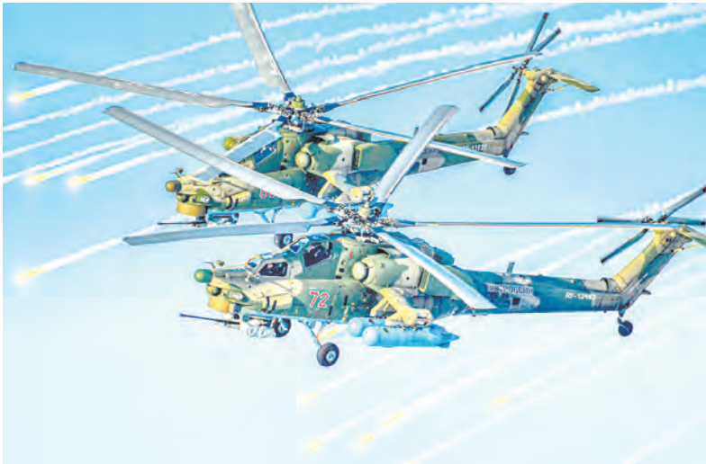
В небе – вертолёты Ми-28