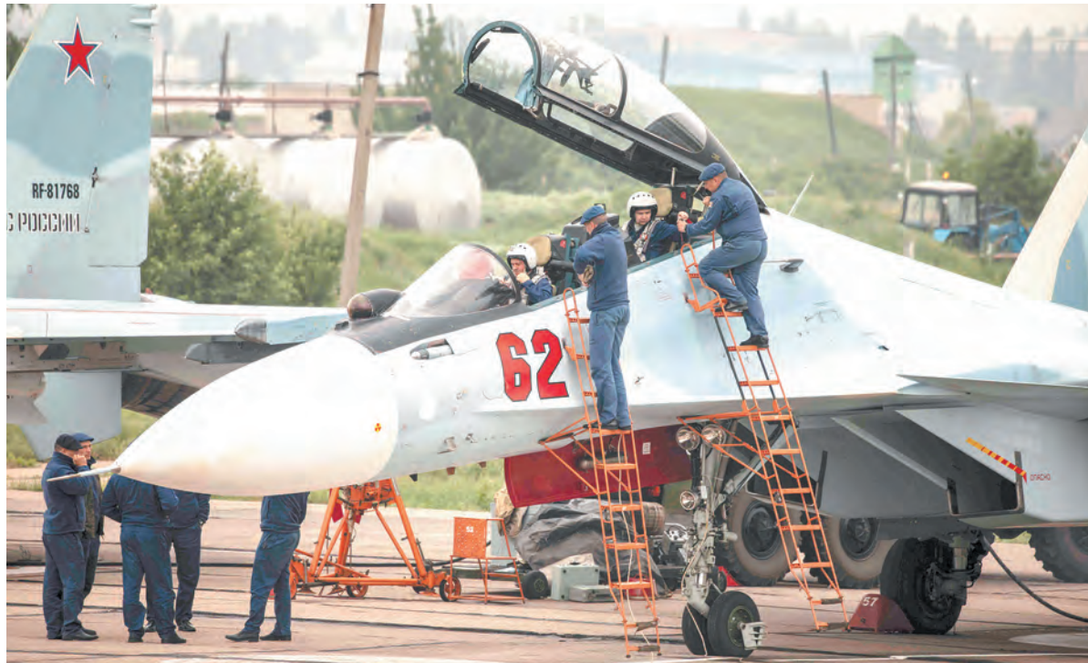
Перед дальним полётом

Предугадать, какими будут предстоящие манёвры, нельзя. С момента прошлого совместно-