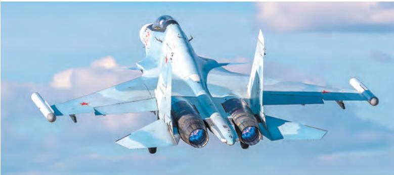
Пошёл на взлёт

го учения тактика боевого применения авиации существенно изменилась. Прежде всего, это связано с поступлением новых образцов вооружения и военной авиационной техники. Например, за последние годы воинские части и соединения Ленинградского объединения перевооружились на современные многоцелевые