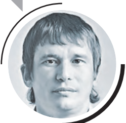
РОБЕРТ АБДУЛЛИН, ПРЕЗИДЕНТ МЕЖДУНАРОДНОЙ ОРГАНИЗАЦИИ КРЕДИТОРОВ

Завтра в Москве открывается 20-й Международный саммит «Металлы России и СНГ». Он зарекомендовал себя как известная «площадка» для выработки решений по вопросам развития горно-металлургического сектора (ГМС), определения главных тенденций на мировом рынке этой продукции, развития бизнес-связей.