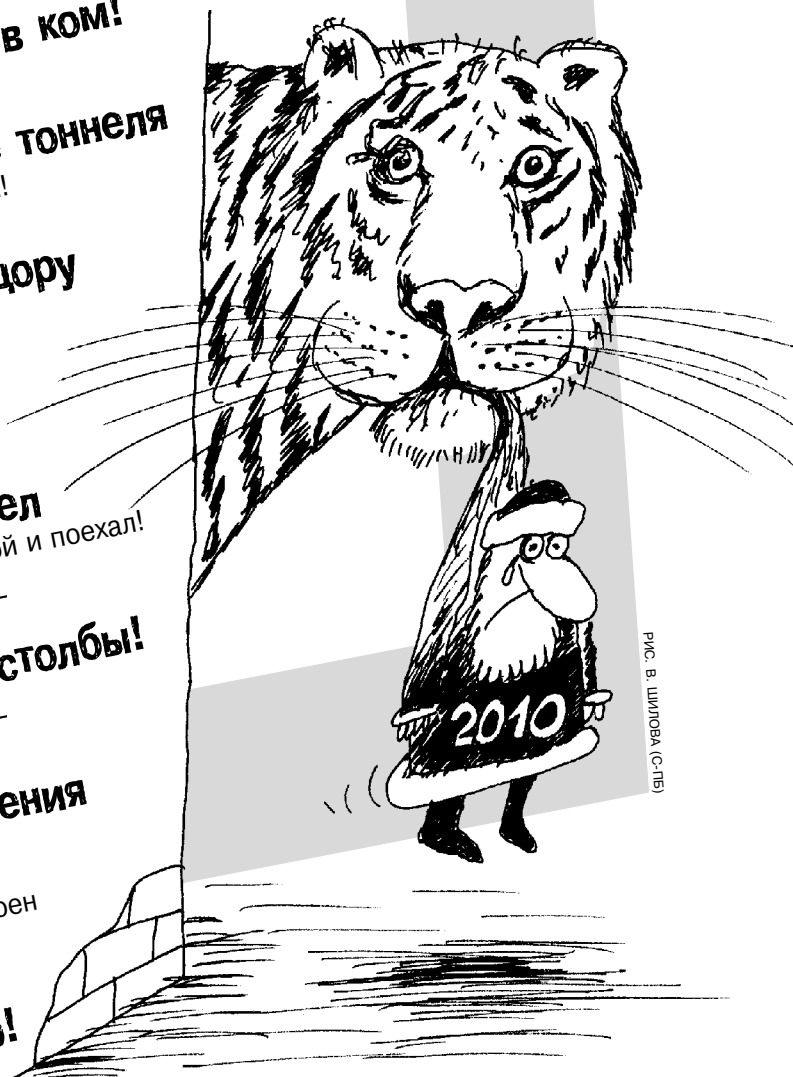
рис. В. Шилова (с-ле)

у Медведева на Спасской башне часы за $ 50 000 000!