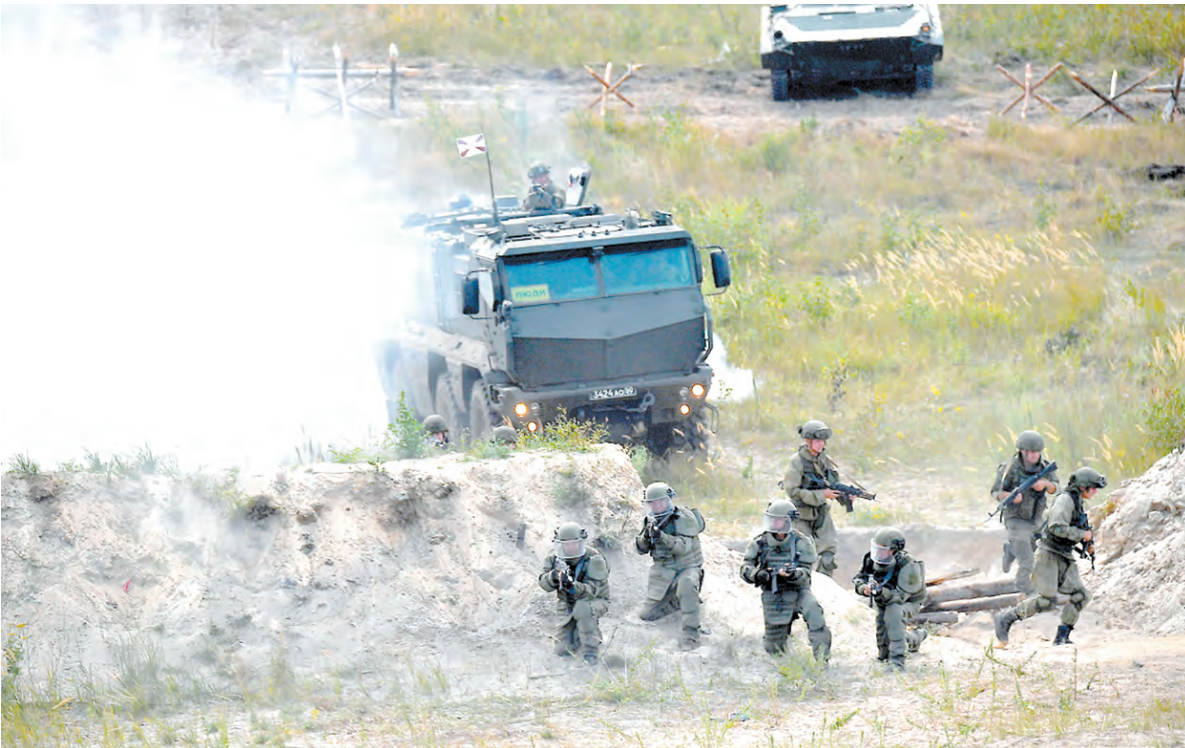
Готовность воинов ЗВО к защите Отечества проверяют в учебных боях

Контрольная проверка войск ЗВО направлена на повышение уровня боевой и оперативной подготовки войск и сил военного округа, совершенствование форм и способов проведения учений, занятий и тренировок с учетом складывающейся обстановки в границах ответственности, сообщает пресс-служба ЗВО.