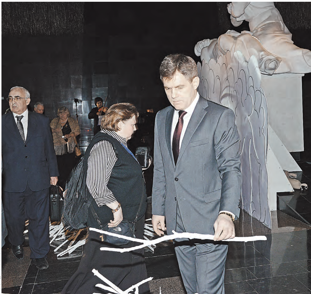
Вечере-реквиеме принял участие посол Беларуси в России Игорь Петришенко.

Закончился вечер-реквием в Зале Памяти и Скорби, где высокие гости провели символическую церемонию гашения пожара войны: на специально инсталлированную декорацию, представляющую костер, сложенный вокруг фигур людей, проецировалась хроника мирной жизни, демонстрируя волю