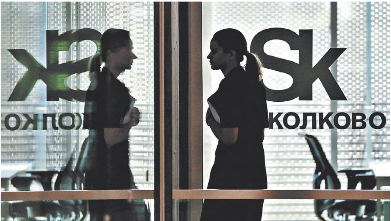
Весной в летнюю школу «Сколково» приедут белорусские студенты.

1 — Одной из важнейших тем, которые развиваются в соответствии с программой «Мониторинг-СГ», является получение радиолокационных данных. Мы сейчас работаем с оптическими каналами, видим участки земной поверхности, но сильно мешают облачность, атмосферные отклонения. Радиоканал будет всегда чист. Думаю, по результатам программы «Мониторинг-СГ» следующий белорусский космический корабль понесет уже функции радиоканала. Если решение о постройке нового космического аппарата будет принято, то в течение трех лет все будет сделано.