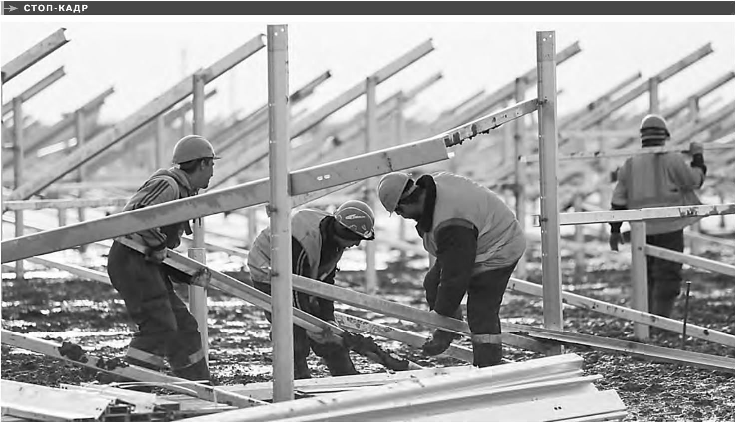
В Астраханской области впервые будут получать электроэнергию от солнца. Солнечная электростанция «Заводская», одна из первых в России, возводится в поселке Володарском. На выбранной площадке забито в землю пять тысяч свай, смонтированы высоковольтные линии, залит фундамент под блочно-модульные инверторные установки. Всего будет установлено 57 тысяч фотоэлектрических модулей. Проектная мощность СЭС — 15 мегаватт, что позволит на 25 процентов обеспечить потребности поселка в электроэнергии.

ДЕПУТАТЫ приняли поправку в областной закон, которая касается почти 800 тысяч жителей Ростовской области, имеющих право на 50-процентную компенсацию расходов за услуги ЖКХ. Теперь она будет рассчитываться исходя не из региональных стандартов потребления, установленных для льготных категорий, а из фактически потребленного объема услуг, но не выше нормативов потребления.