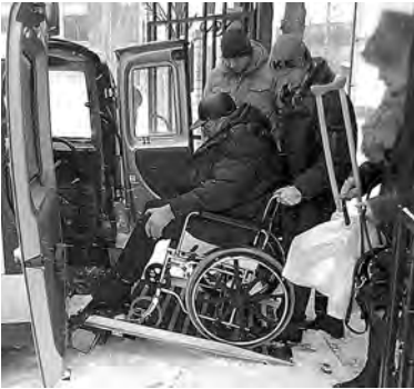
Поднять человека в коляске в машину — это полдела. А как помочь ему спуститься с этажа?