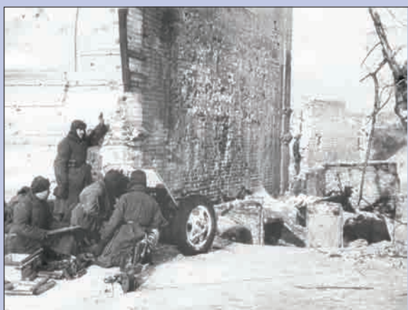
▲ Советский артиллерийский расчёт во время боя в Сталинграде