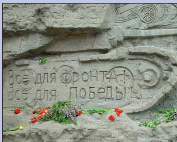
Историко-мемориальный комплекс Героям Сталинградской битвы на Мамаевом кургане