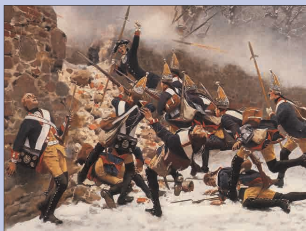
Историко-мемориальный комплекс Героям Сталинградской битвы на Мамаевом кургане