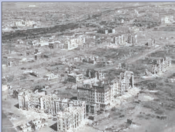
▲ Панорама разрушенного Сталинграда

Начало разгрома фашистских войск под Сталинградом Художник Г.И. Марченко, 1975 г.