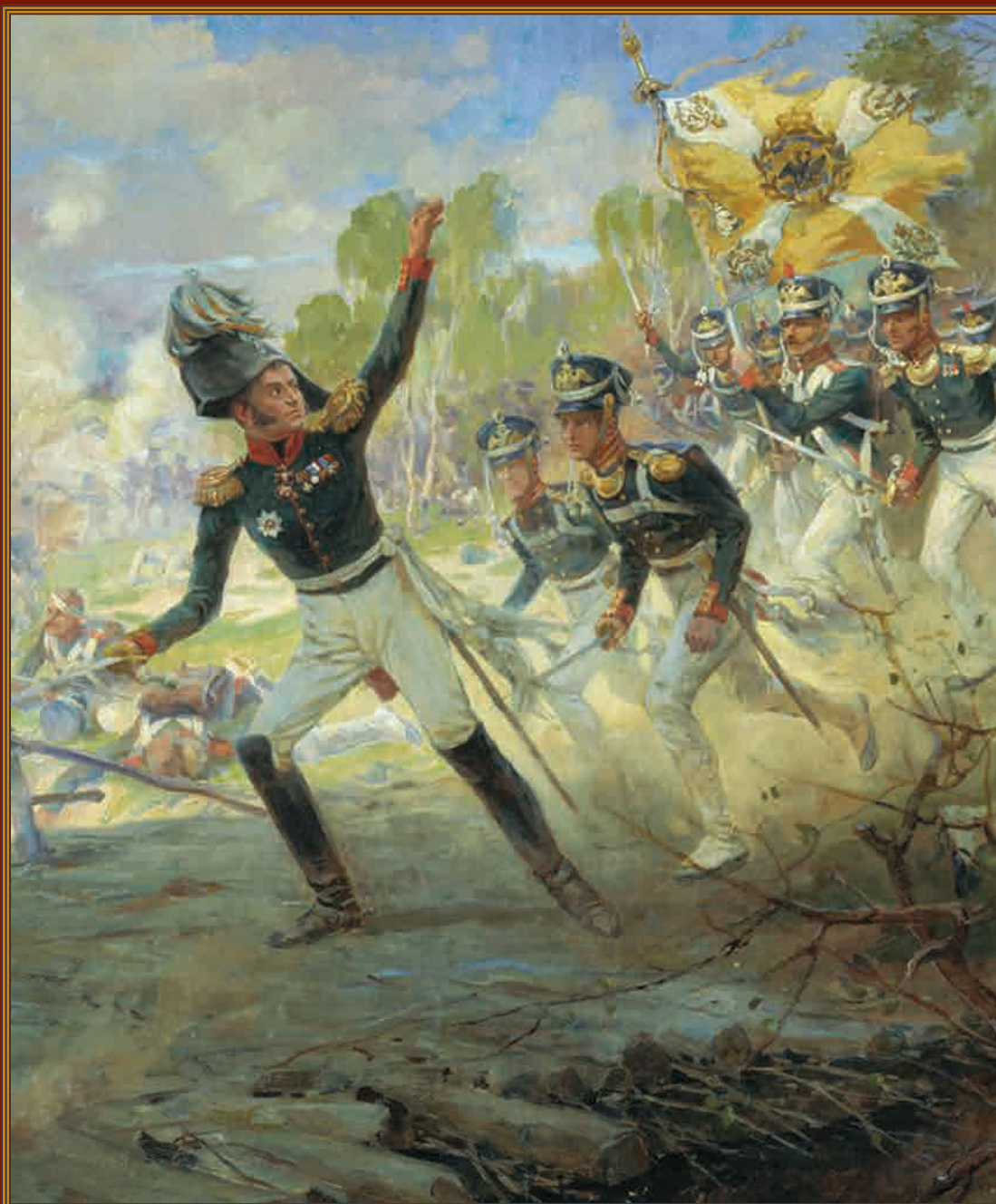
Подвиг солдат генерала Н.Н. Раевского под Салтановкой Художник Н.С. Самокиш

17 июля — 70 лет со дня начала Сталинградской оборонительной операции