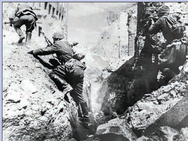
▲ Сталинградская битва. Советские солдаты в атаке. Примерно 1943 г.