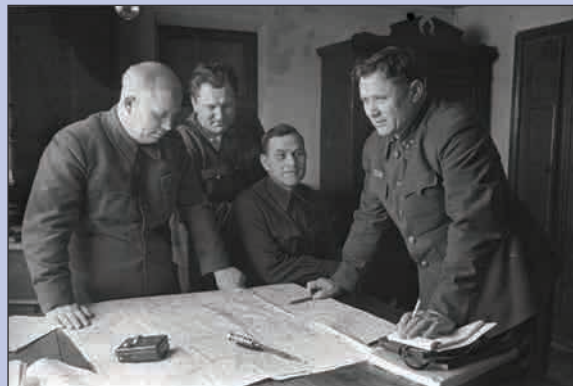
▲ Заседание Военного совета Сталинградского фронта