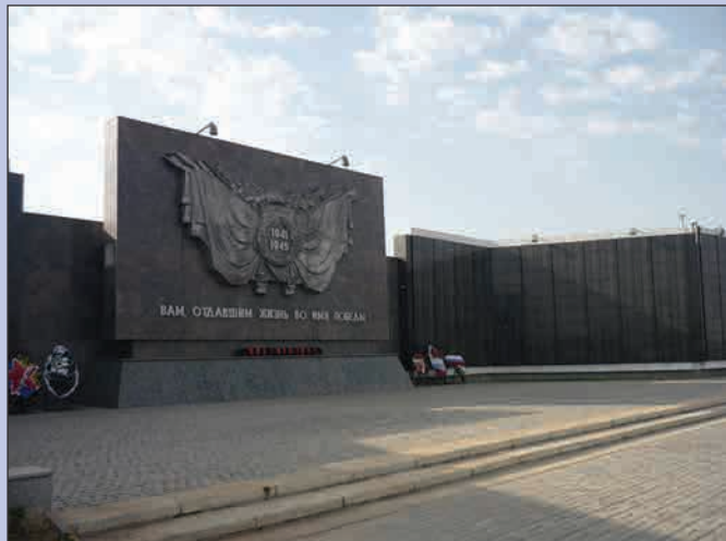
▲ Братское захоронение на восточном спуске Мамаева кургана