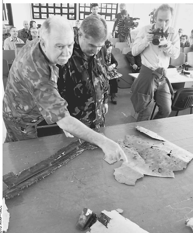
Абхазия. Руководители Министерства обороны непризнанной республики демонстрируют журналистам обломки сбитого беспилотника

этому президент решил отвлечь внимание сограждан от внутриполитического кризиса и спровоцировал очередной громкий скандал с Россией. А заодно попытаться подключить к новому выяснению отношений с Москвой своих вашиingtonских покровителей. → стр. 2