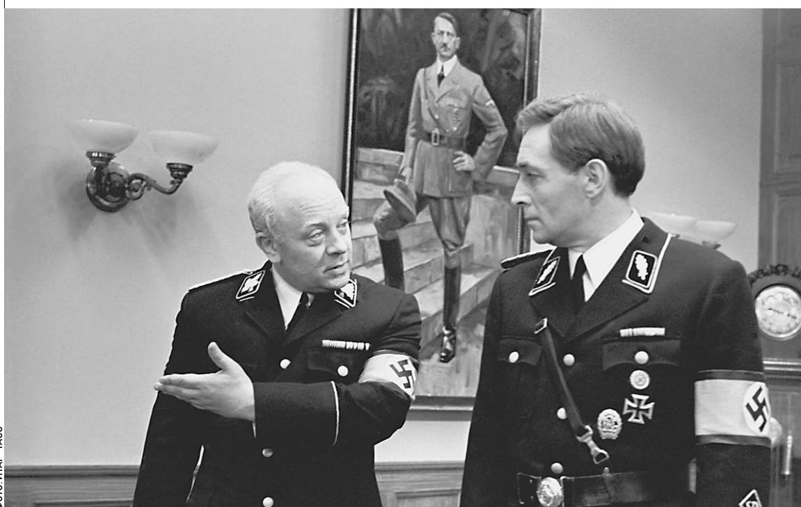
Знаменитая сага о Штирлице снималась в павильонах киностудии им. Горького

В общем, несколько попыток продажи так и не увенчались успехом. Хотя кусочек лакомый. → стр. 9