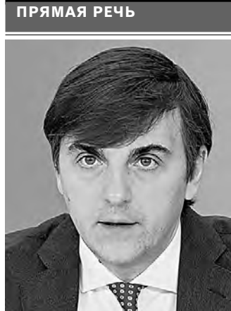
Сергей Кравцов, министр просвещения РФ:

Дефицит кадров на предприятиях Нижегородской области около 20 тысяч человек. Причем большинство — это рабочие специальности. Поэтому мы активно включились в программу «Профессионалитет», — сообщил Глеб Никитин. По его словам, в прошлом году в регионе созданы кластеры по металлургии, автомобилестроению и сельскому хозяйству, объединившие учебные заведения и производства. В текущем планируется создать еще три в других отраслях.