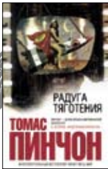
Пинчон Т. Радуга тяготения / Пер. с англ. А.Грызуновой, М. Немцова. М.: Эксмо, 2012. — 768 с.