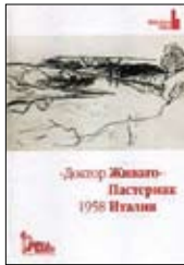
Доктор Живаго: Пастернак, 1958, Италия. Антология статей / Пер. с ит. А. Бибикова, Ю. Галатенко, А. Голубцова; Ред.-Сост. С. Гардзони, А. Речча. М.: Река времен, 2012. — 424 с.

5 В ноябре 1957 года в итальянских книжных магазинах появился «Доктор Живаго». Через пару месяцев книга стала бестселлером. А еще о ней много писали. Настоящая антология — сборник статей, рецензий и эссе, написанных итальянскими интеллектуалами ровно пятьдесят пять лет назад.