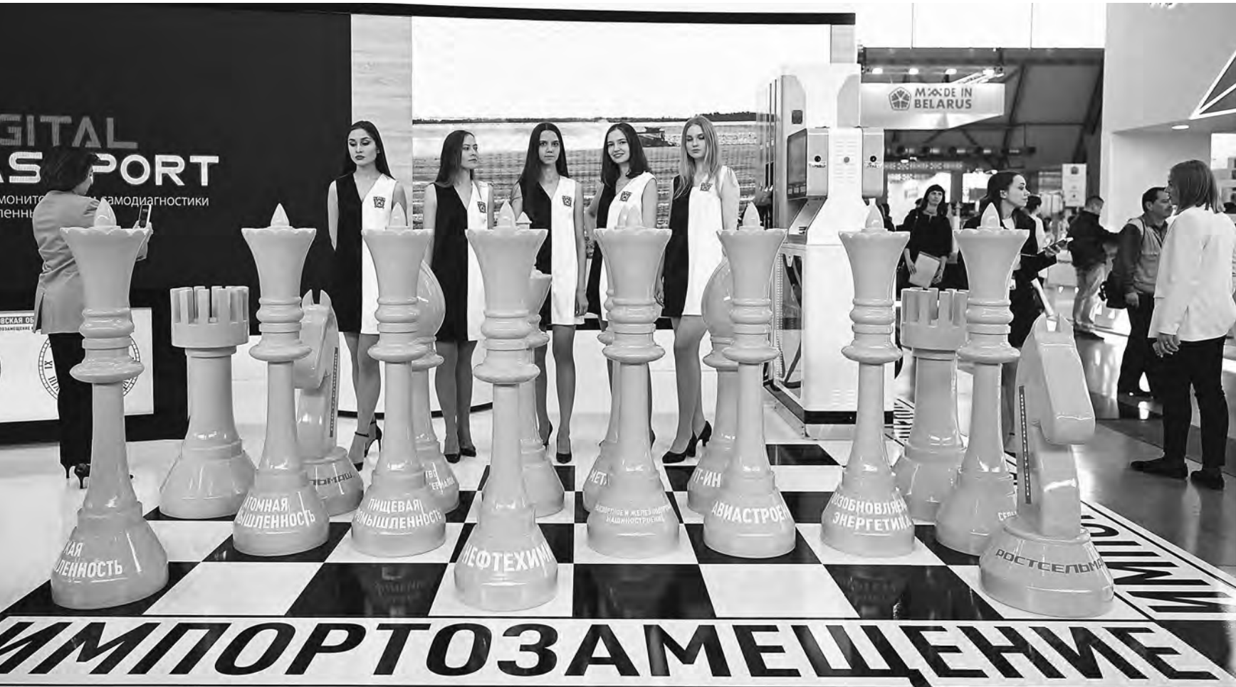
ТАТЬЯНА МАЛЫШЕВА / РИА НОВОСТИ