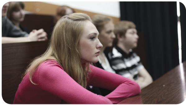
Студенты ФЭиМ хотят больше точек доступа wi-fi.