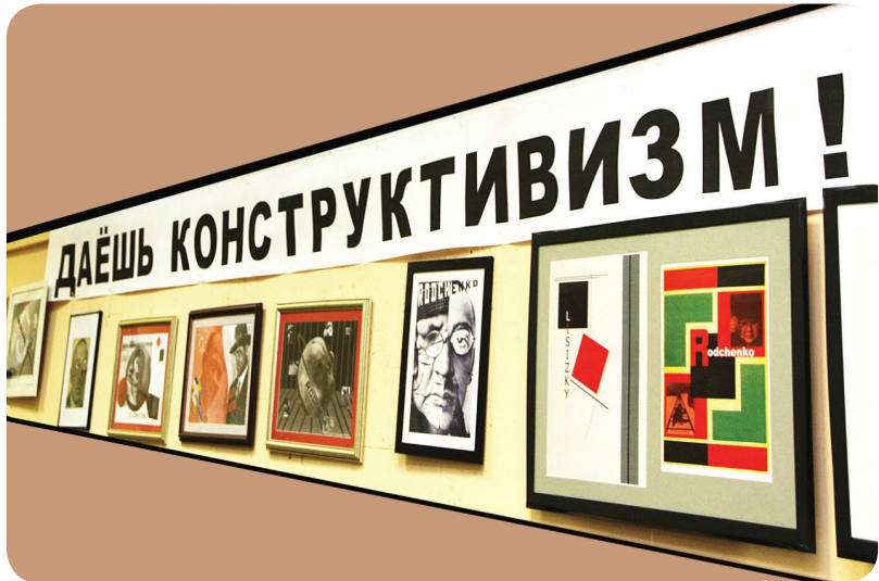
Учебные работы на тему конструктивизма порадовали яркими и смелыми решениями.

Когда зрители разошлись, мне удалось поближе рассмотреть каждую работу. Больше всего впечатлило, что все эти плакаты созданы не профессиональными и даже не начинающими художниками, а студентами первого курса! Несмотря на некоторые недочеты, от которых не застрахованы даже признанные мастера своего дела, ребята продемонстрировали свободный полет фантазии,