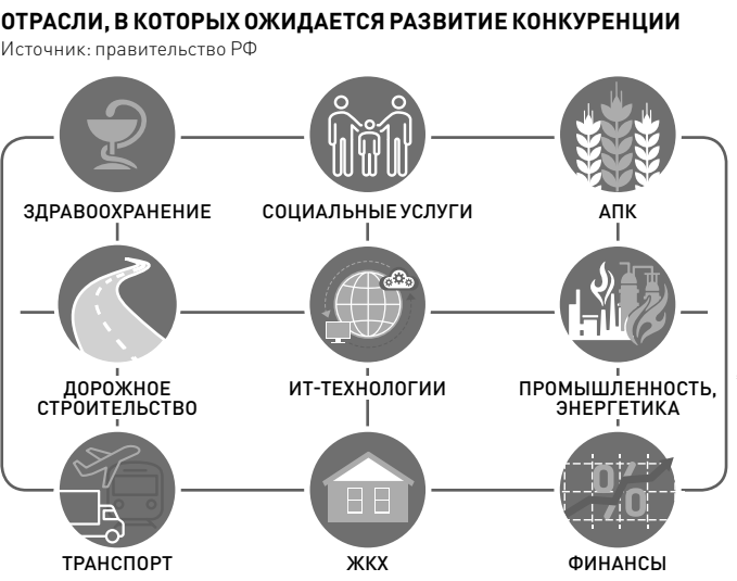
ИНФОГРАФИКА: ИТГ / АЛЕКСЕЙ СТРИЖИ / АННА ДУРОВА

— Засилье ГУПов, на первый взгляд, является нарушением конкурентной среды: оно способствует повышению цен, благоприятствует развитию коррупционной составляющей. ... Но в данном случае, мне кажется, необходимо вести речь и о другом: почему на торгах, проводимых тем или иным комитетом, выигрывают всегда одни и те же игроки? Сложился уже пул таких малых предприятий, которые permanently выигрывают аукционы. Это должно интересовать УФАС не меньше. Ведь именно эта ситуация препятствует созданию нормальной конкурентной среды.