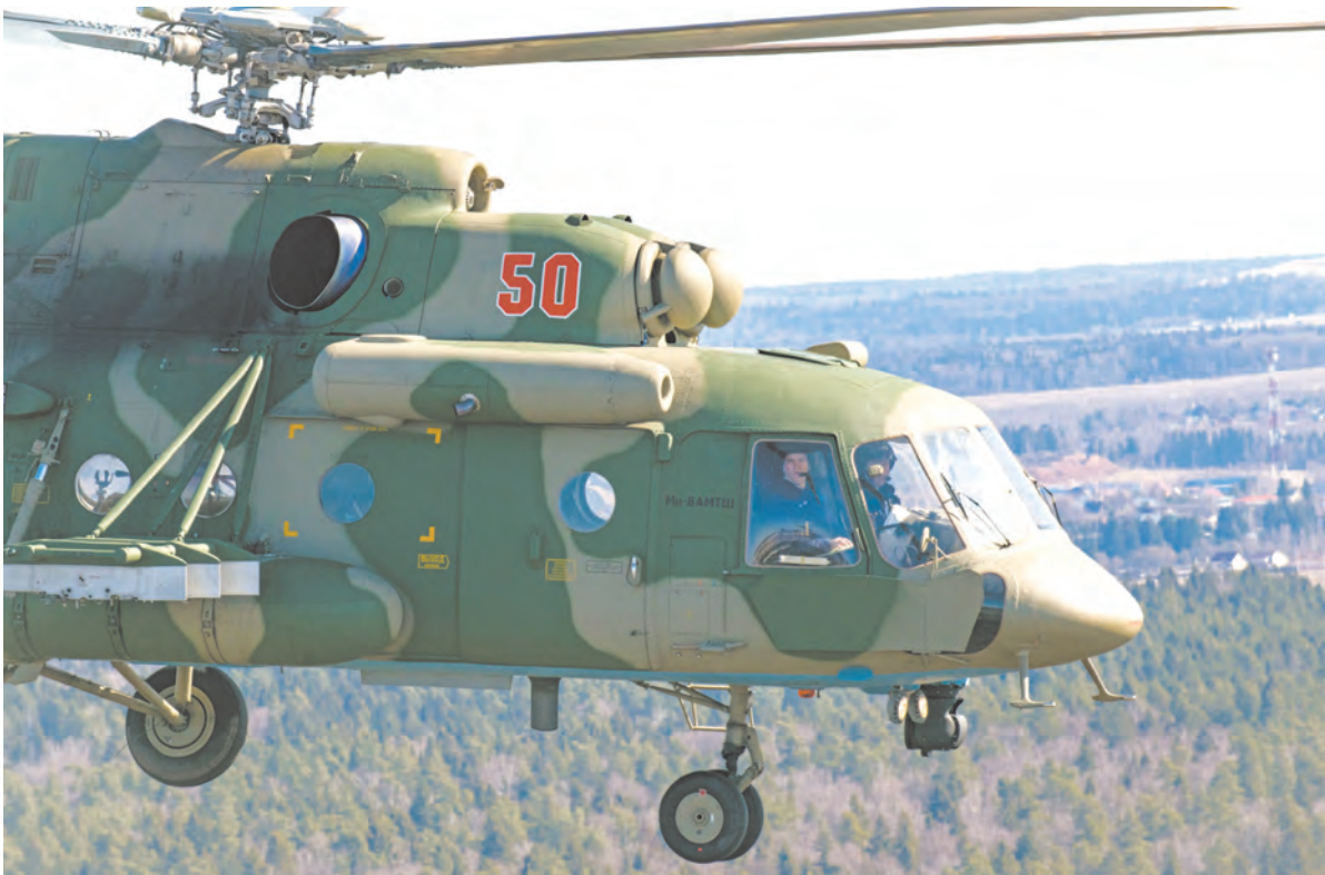
Винтокрылыми машинами доверено управлять лучшим из лучших пилотов

машин – 76, ровно по числу лет, прошедших с победных майских дней 1945 года.