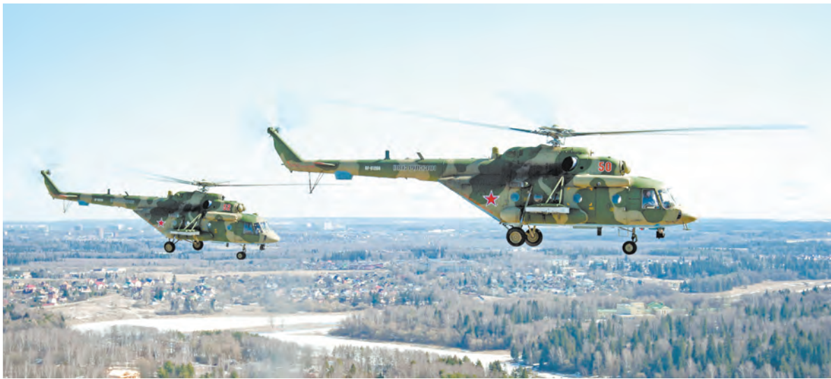
Выдерживая в едином строю скорость и интервалы

Всего в День Победы над Москвой пролетят 23 вертолёт и 53 самолёт – общее число машин – 76, ровно по числу лет, прошедших с победных майских дней 1945 года.