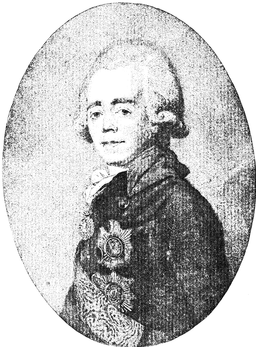
Императоръ Павелъ I.