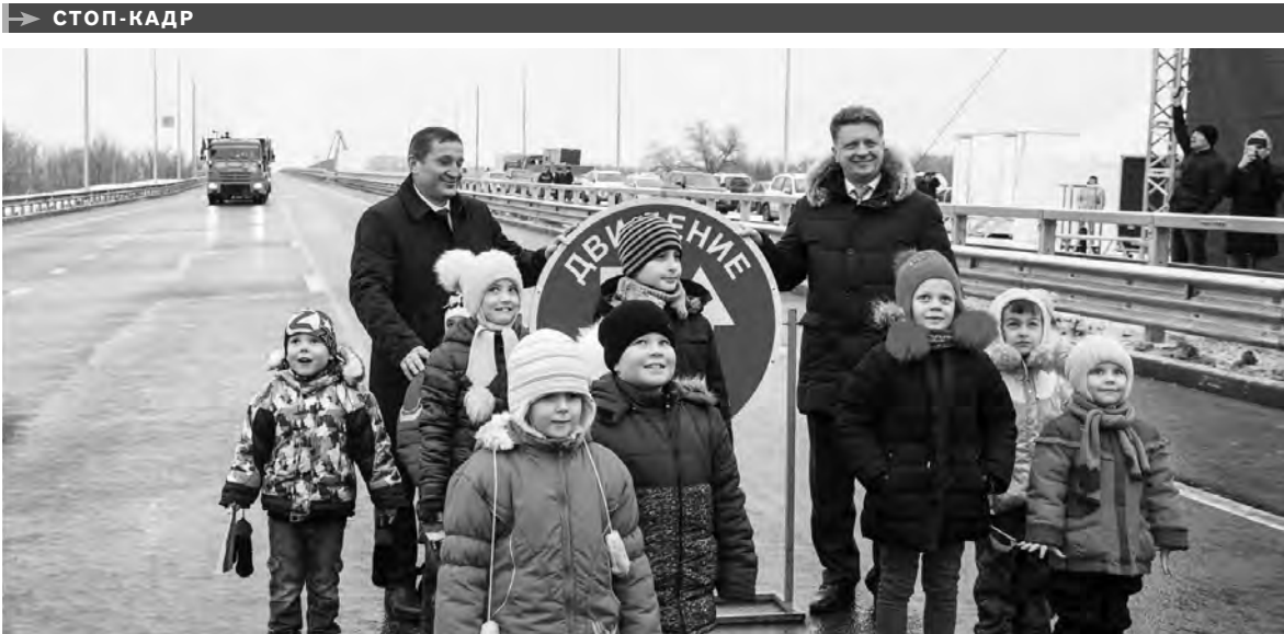
Новый автомобильный мост позволит разгрузить магистрали Волгограда, убрав с них машины, движущиеся со стороны Волжского и Казахстана. Транспортный коридор открывает выход на федеральные трассы московского, ростовского и сызранского направлений. Общая стоимость объекта – более 14 миллиардов рублей.

НА БАЗЕ региональной Адвокатской палаты создан специальный центр, где любой житель Астрахани или области может задать вопрос специалисту и получить бесплатную юридическую помощь. Чаще всего сюда обращаются по вопросам ЖКХ и материнского капитала. Центр находится на улице Свердлова, 56, и будет работать еженедельно по вторникам и средам с 10 до 17 часов (перерыв с 13 до 14 часов).