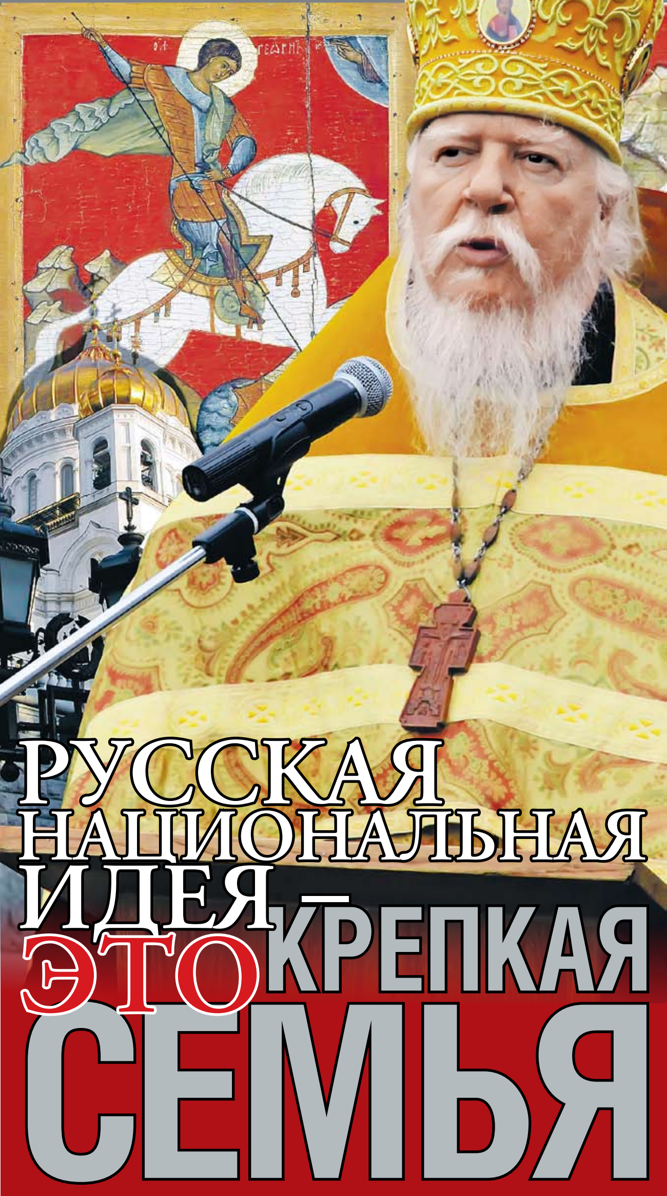
Коллаж Андрея СЕДИХ (фото предоставлено Синодальным отделом по взаимодействию с Вооруженными Силами и правоохранительными учреждениями)

— Такое качество, как веротерпимость, должно быть в идеале присуще каждому христианину. В христианской религиозной культуре терпение и любовь к ближнему стоят в числе высших добродетелей. Если же человек не является христианином, то для него все названные вами слова останутся пустым звуком. В недавних событиях на Манежной площади было множество людей, которые наверняка не раз в своей жизни слышали о толерантности, что никак не отразилось на их жизни. Поэтому для достижения межнационального согласия русским людям нужно вернуться к православному веру и вспомнить о тысячелетнем историческом опыте, когда на территории России мирно существовали представители самых разных народов. Русские люди освоили, колонизовали огромные пространства. При этом все