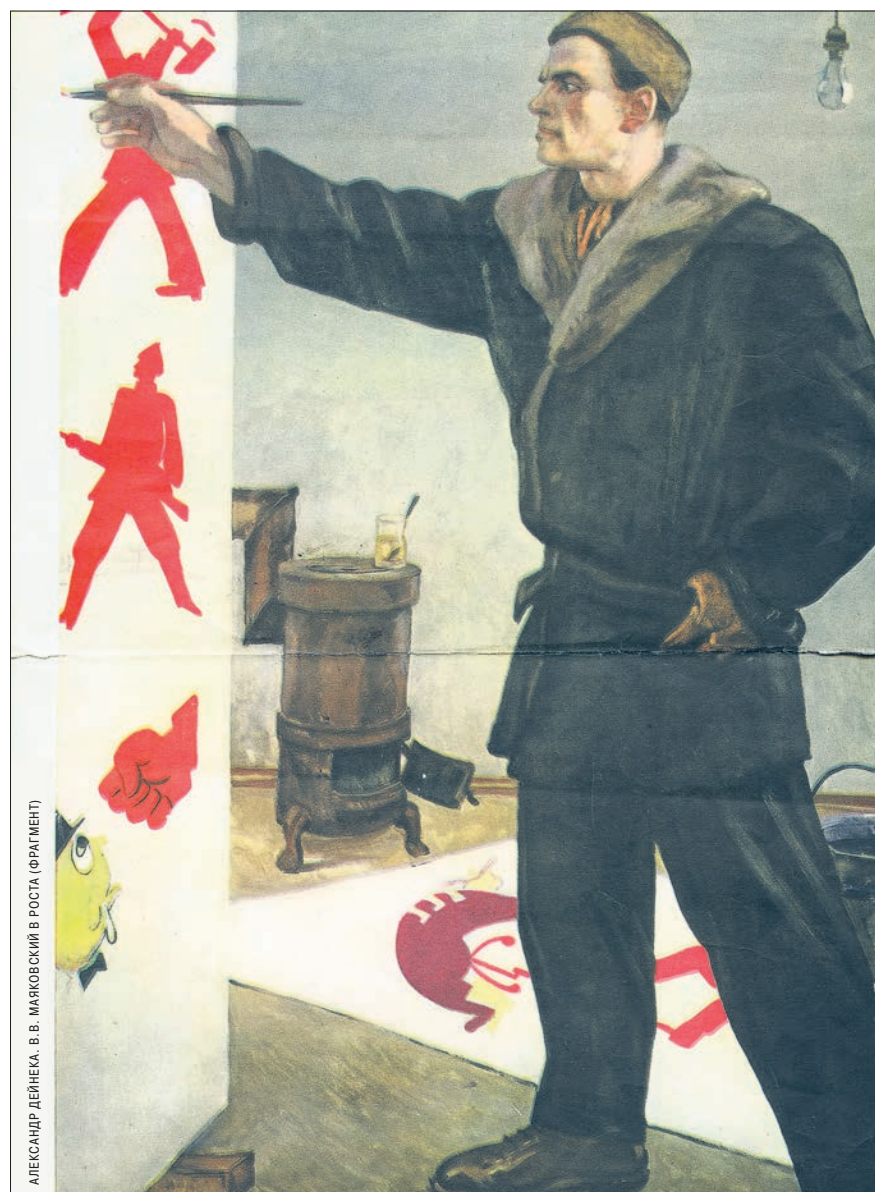
АЛЕКСАНДР ДЕЙНЕКА. В. В. МАЯКОВСКИЙ В РОСТА (ФРАГМЕНТ)

Миф Владимира Маяковского продолжает волновать умы – как в России, так и за рубежом