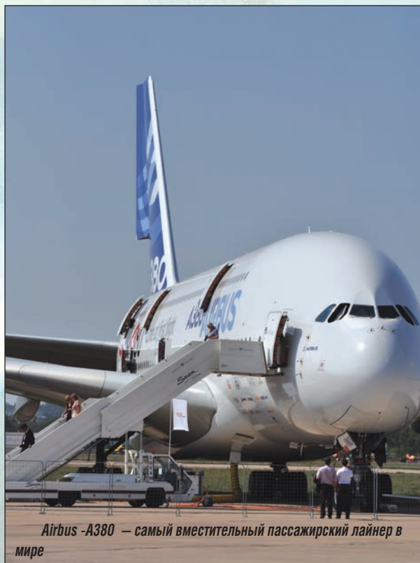
Airbus -A380 — самый вместительный пассажирский лайнер в мире