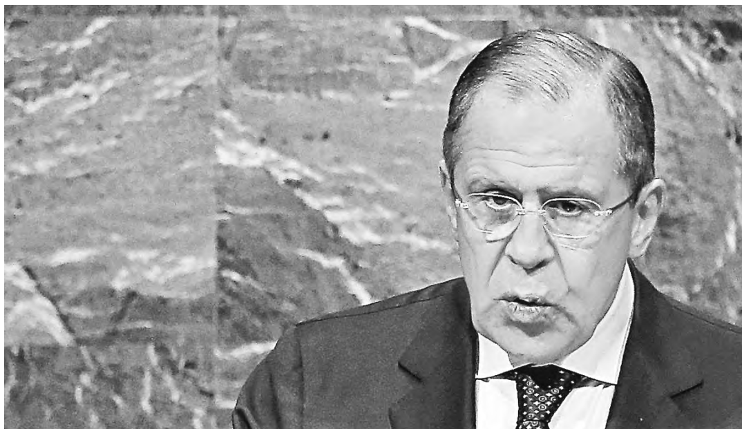
Выступление Сергея Лаврова на форуме включало ответ на вопрос, чем Россия может помочь нуждающимся странам.