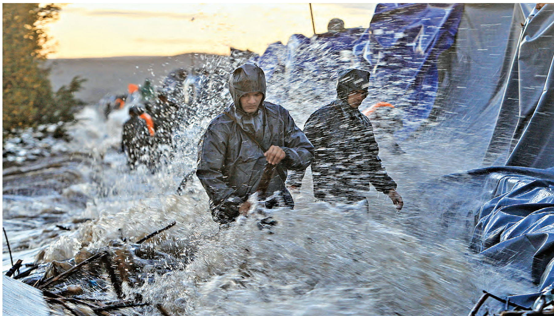
Наводнение в Приморье может повториться. Но никто пока не может оценить его силу.