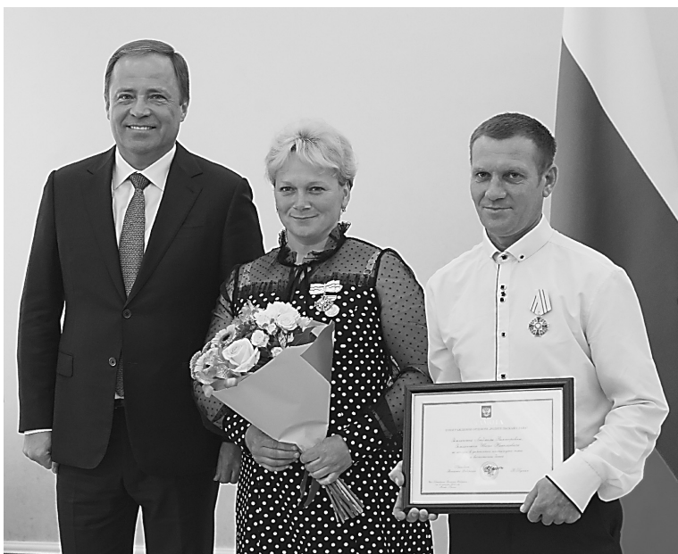
ПРЕСС-СЛУЖБА ПРАВИТЕЛЬСТВА САМАРСКОЙ ОБЛАСТИ