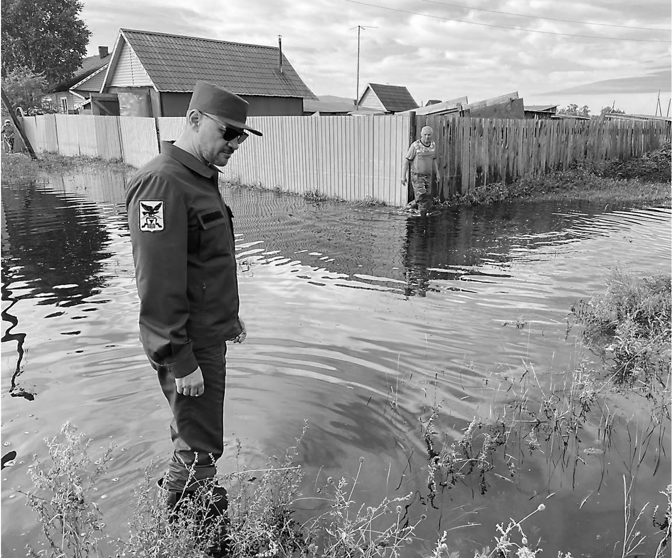
ТОПОГРАФИЧЕСКАЯ КАРТА РАЙОНА ПРАВИТЕЛЬСТВА ЗАБАЙКАЛЬСКОГО КРАЯ

Из-за паводка пришлось по-новому организовать контроль и кормозаготовительную кампанию в районе. Для обеспечения скота в этом году нужно более восьми тысяч тонн сена, но прогноз неутешительный — всего на две тысячи тонн. Недостающий