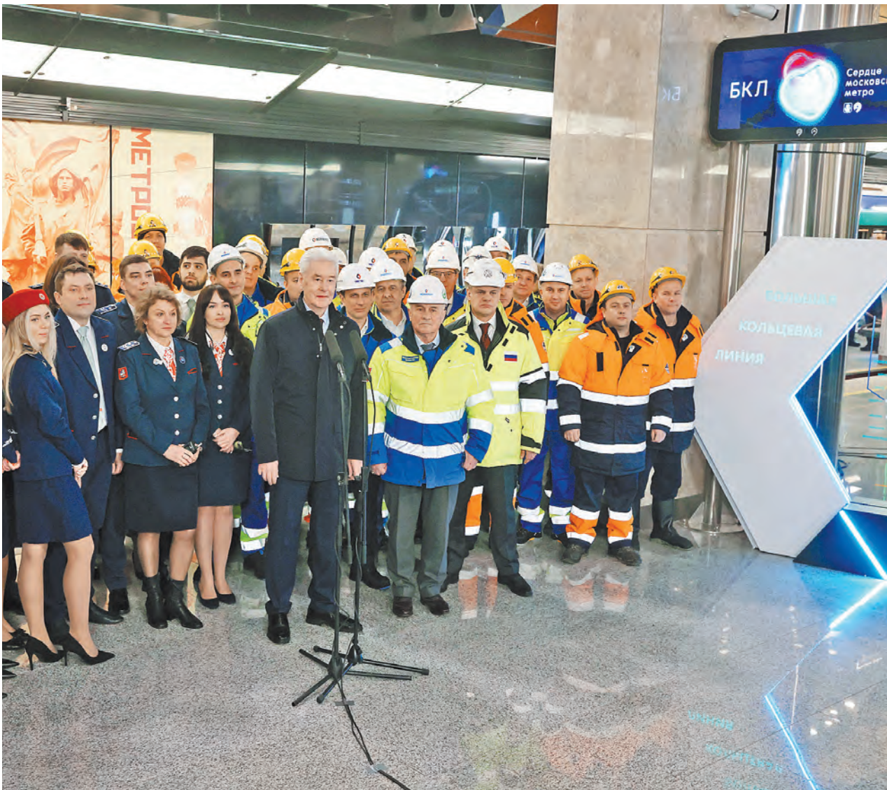
Сергей Собянин попросил президента подписать новую схему метро, где есть вся Большая линия метро. Владимир Путин расписался.