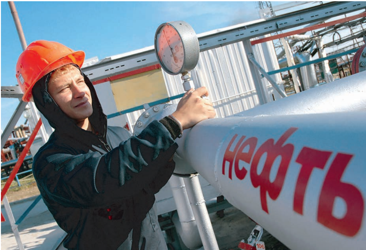
Нефть сделала правительству России и ЦБ неожиданный подарок. abnews.ru

В среднесрочной перспективе 2–3 месяцев цены на нефть могут вернуться в диапазон $50–54, прогнозируют аналитики «Бинбанка». Фундаментальные факторы все еще остаются достаточно слабыми – хотя мировые запасы сырья и продемонстрировали некоторое снижение в августе и сентябре, они все еще остаются значительно выше средних 5-летних уровней.