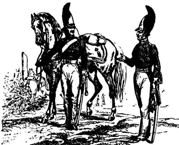
Драгуны русской императорской гвардии. С грав. XIX в.