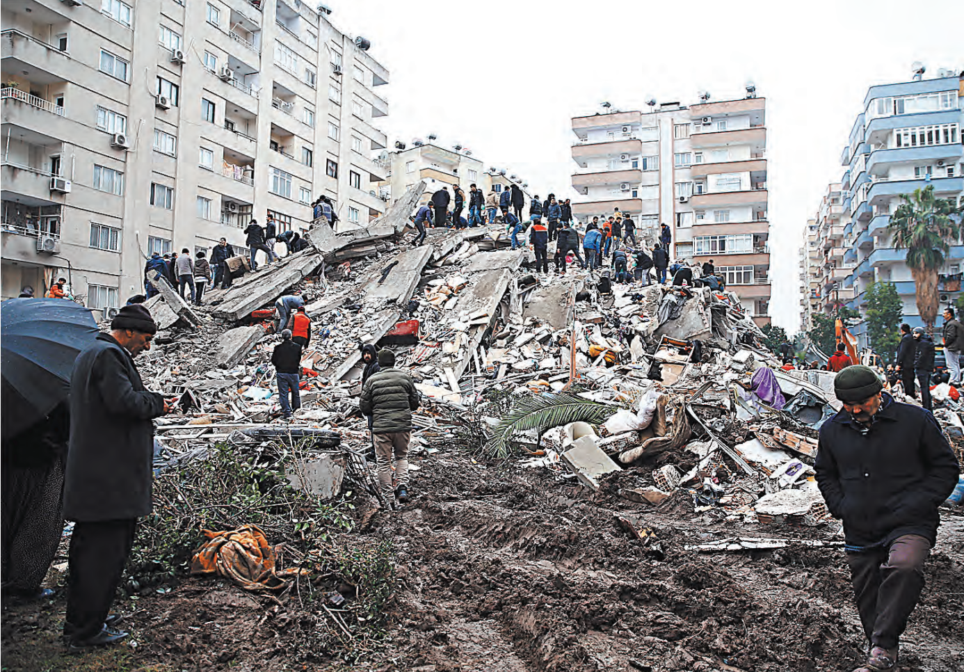
Мощнейшие подземные толчки разрушили многоэтажку в турецком городе Османие. Всего землетрясение уничтожило в стране почти 3 тысячи домов.

Россия одной из первых стран предложила свою помощь Турции и Сирии. МЧС России выразило готовность отправить в регион профессионалов, кото-