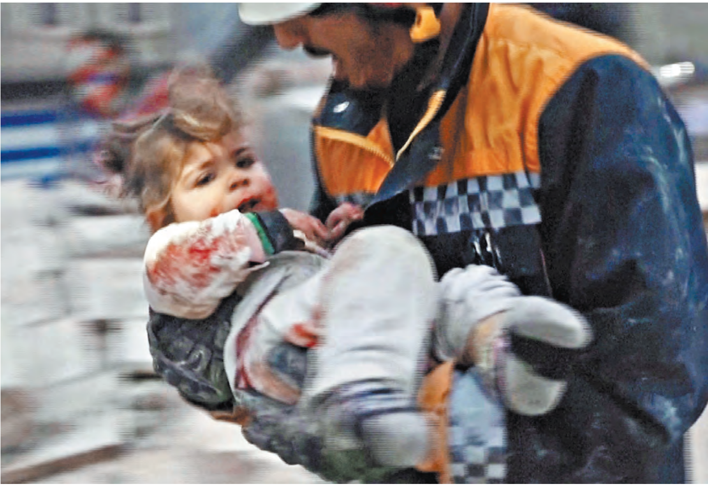
В масштабном бедствии находится место и историям спасения из-под завалов: этой малышке из сирийского Азаза повезло.

рые имеют большой опыт разбора завалов на месте рухнувших многоэтажных зданий. НАТО, Евросоюз предложили помощь только Турции по поиску выживших и локализации последствий стихийного бедствия. Желания помочь Сирии, разоренной гражданской войной, страны Запада, ранее наложившие санкции на президента Башара Асада, не выразили. Так, руководство ЕС мобилизовало более 10 поисково-спасательных групп для оказания помощи Турции, но не Сирии. Власти Израйля заявили о том, что получили сирийский запрос о помощи в ликвидации последствий землетрясения и готовы выполнить его. Это будет крайне редким случаем сотрудничества между двумя враждующими государствами, отмечает Guardian.