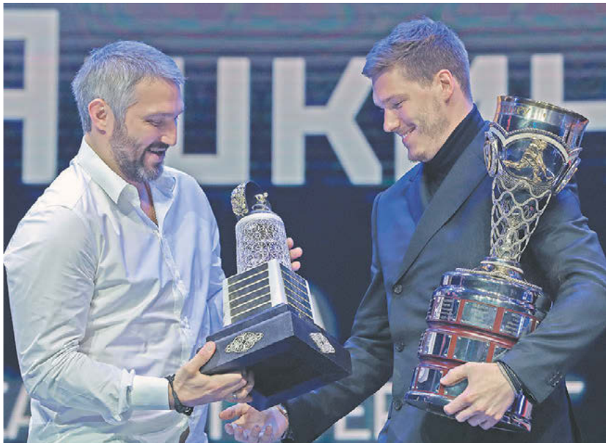
18 мая. Барвиха. Александр Овечкин и Дмитрий Яшкин на вечере, посвященном закрытию сезона КХЛ