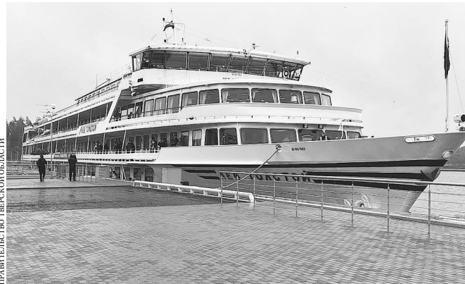
Первые 170 пассажиров приехали в новый порт на теплоходе «Лев Толстой».