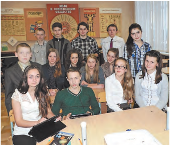
Вот они, закатанные в «битвах» знатоки из Ходосовской средней школы.