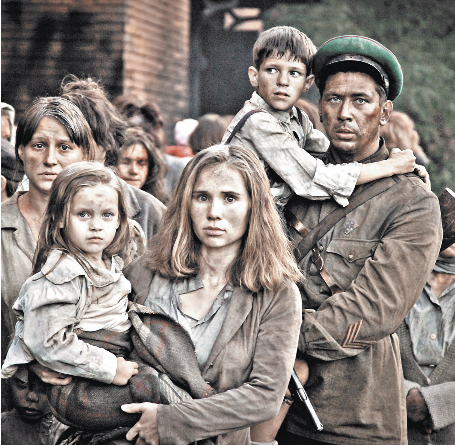
КАРТИНА ИЗ ФИЛЬМА «БРЕСТСКАЯ КРЕПОСТЬ»

1957 году крепость посетили свыше 150 тысяч человек.