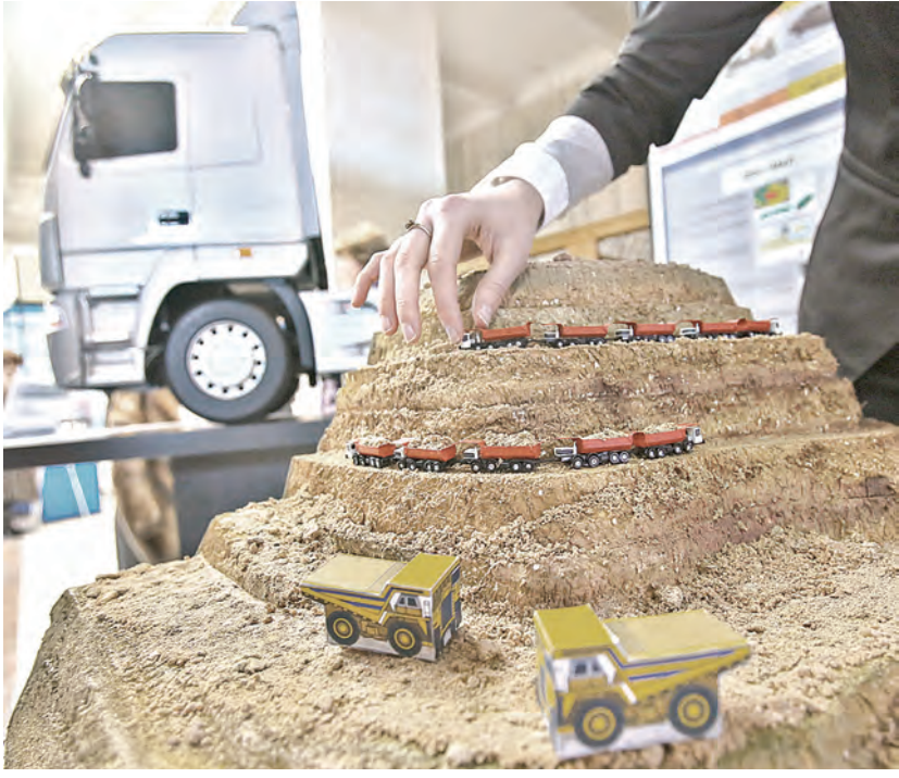
Сейчас уникальный автопоезд активно «тренируется» в выставочных карьерах.

Но ученые Объединенного института машиностроения не ждут у моря погоды. На упомянутой академической выставке они также показали макет седельного тягача экологического стандарта Евро-6, хотя в России и Беларуси только с этого года вступили в