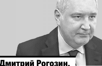
Дмитрий Рогозин, заместитель председателя правительства РФ