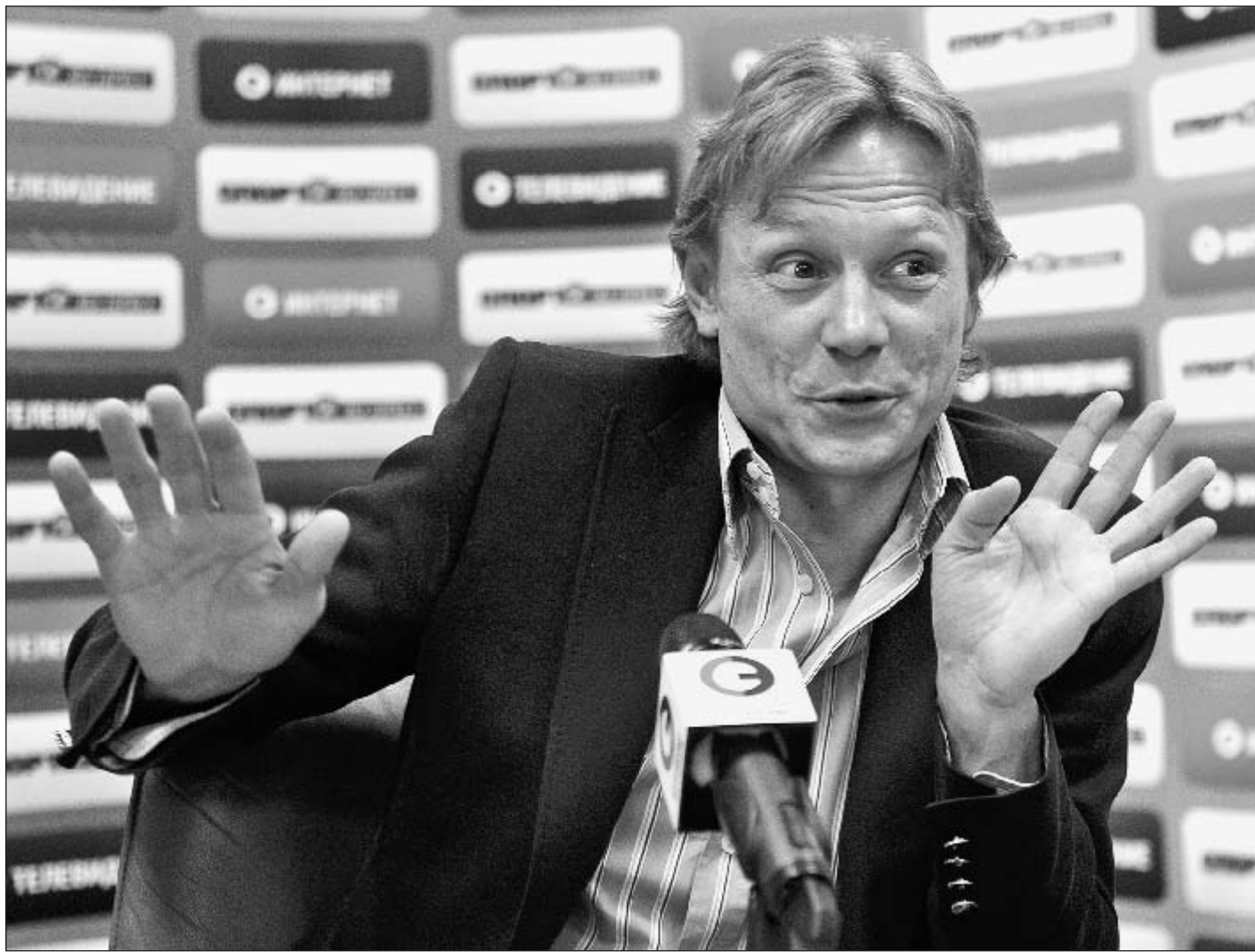
Вчера. Москва. Валерий КАРПИН в редакции «СЭ».

Вчера в гостях у «СЭ» побывал бывший главный тренер «Спартак»