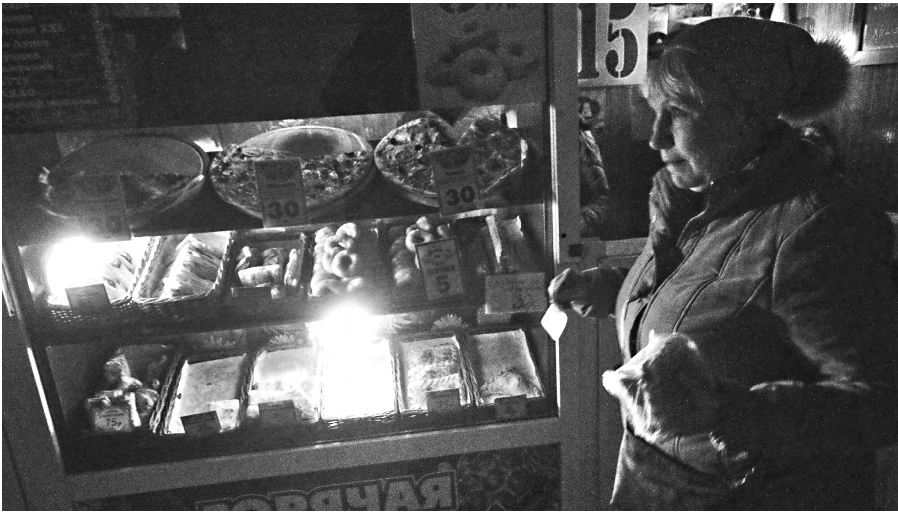
Подрыв линии электропередач на Украине оставил без электричества 1,9 миллиона жителей Крыма.

Елена Гусакова, Сергей Винник, «Российская газета», Крым