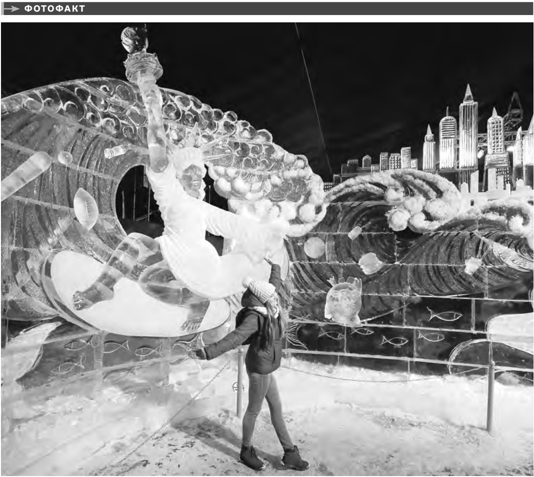
В Петербурге продолжается фестиваль ледовых скульптур ICE FANTASY—2019. В шатре рядом с Нарышкиным бастионом Петропавловской крепости в этом году представлены работы на тему «Путешествие вокруг света» — древние египетские фараоны, знаменитая статуя Свободы, северные олени и пингвины с Южного полюса. Экспозиция будет работать до 10 февраля.

ВЗЯТЬ ленту на память можно в отделениях почты, МФЦ, центрах приема коммунальных платежей и в отделениях банков. Кроме того, 18, 25, 26 и 27 января с 17.00 до 18.00 волонтеры будут раздавать их возле станций метро. Сама лента представляет собой полоску ткани оливкового и зеленого цветов. Они повторяют цвета колодки медали «За оборону Ленинграда» — главной награды блокадников.