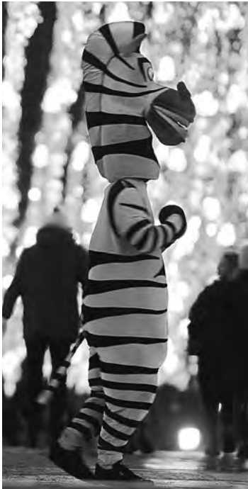
Люди в ростовых куклах чаще всего не обладают актерскими навыками, а значит, бросают тень на всех уличных артистов.

Представители профессионального сообщества считают, что аниматоры в ростовых куклах бросают тень на всех уличных артистов. Для них это весьма тревожно, ведь за долгие годы оригинальные шоу на улицах Петербурга стали одним из неформальных символов города и туристы в принципе относятся к этой сфере с доверием, они ждут чуда и праздника, а единственный фокус, который им могут показать ростовые куклы, — это превращение полного кошелька в пустой.