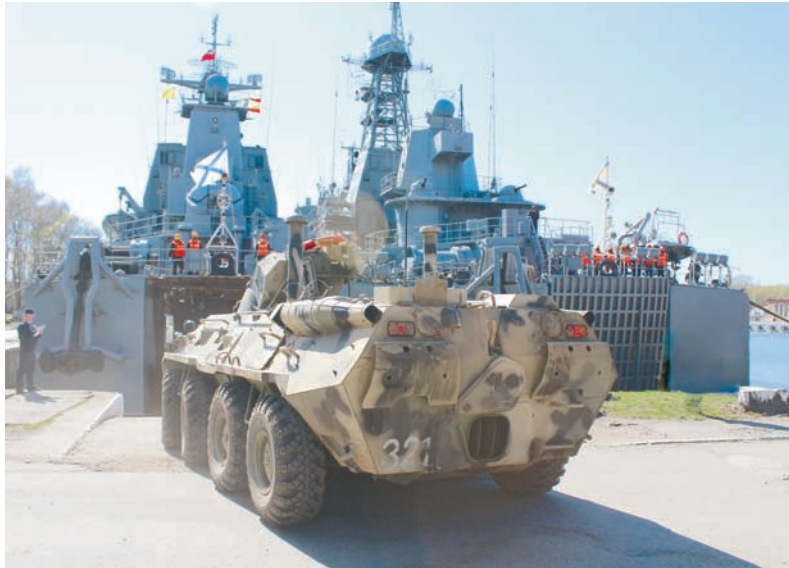
Погрузка боевой техники ДШБ на большой десантный корабль.