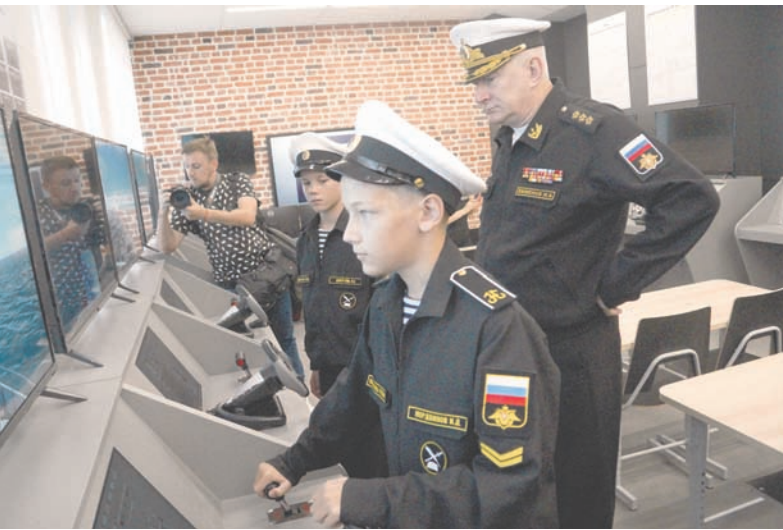
В классе штурманской подготовки.

Ирина ШЕЛЫГИНА