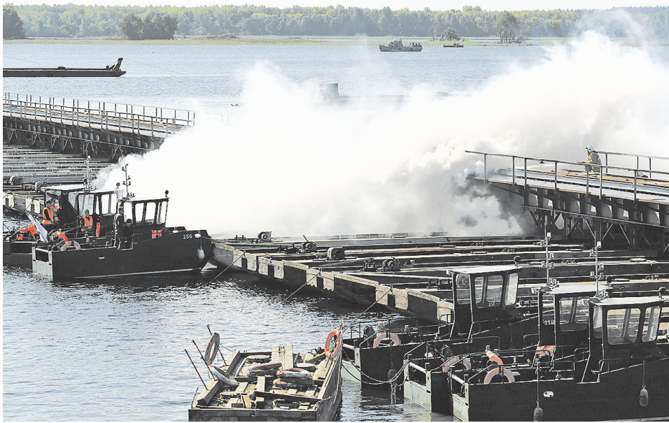
Специалисты МТО по замыслу учения восстанавливают железнодорожный мост.