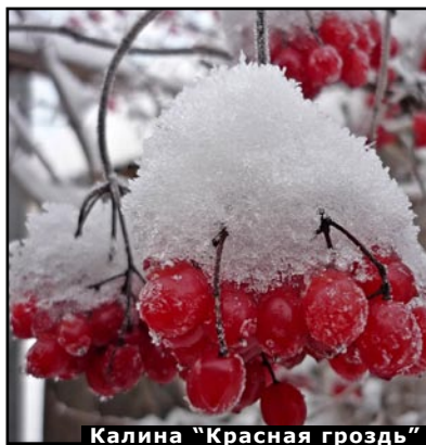
Калина "Красная гроздь"

берёза. Особенно красива она на фоне тёмной зелени хвойных. Это дерево для достаточно большого участка, как и черёмуха Маака - пришелица с дальнего Востока. Этот вид черёмухи отличается очень красивой корой. Она золотисто-оранжевая, шелковистая, блестящая, очень яркая, особенно зимой да ещё освещённая солнцем. Черёмуха Маака декоративна круглый год: весной, во время цветения, летом и осенью, усыпанная гроздьями ягод.