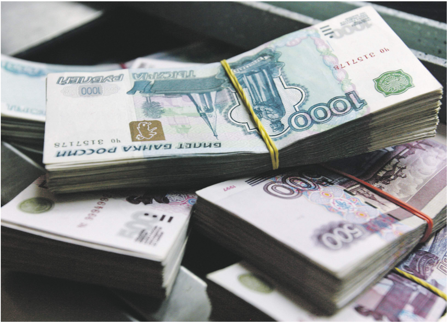
Екатерина Шурова / Иллюстрация