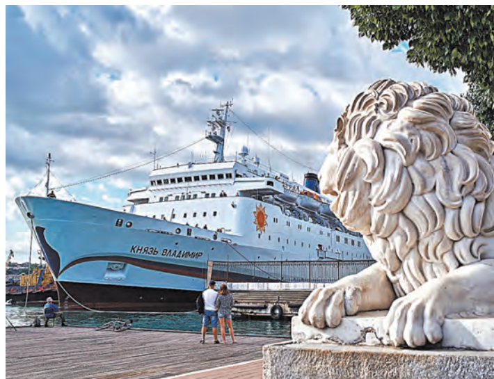
Команда лайнера «Князь Владимир» бережно относилась к участникам «Волны».

«Лиге», «Волне здоровья» в этом году 15 лет. Главную их цель обозначил президент «Лиги» академик Лео Бокерия: «Сделать нашу жизнь лучше». А в применении к самой «Волне» уточнил: «Если после каждого нашего агитационного теплоходного рейса в каждом городе хотя бы один человек задумался о своем здоро-