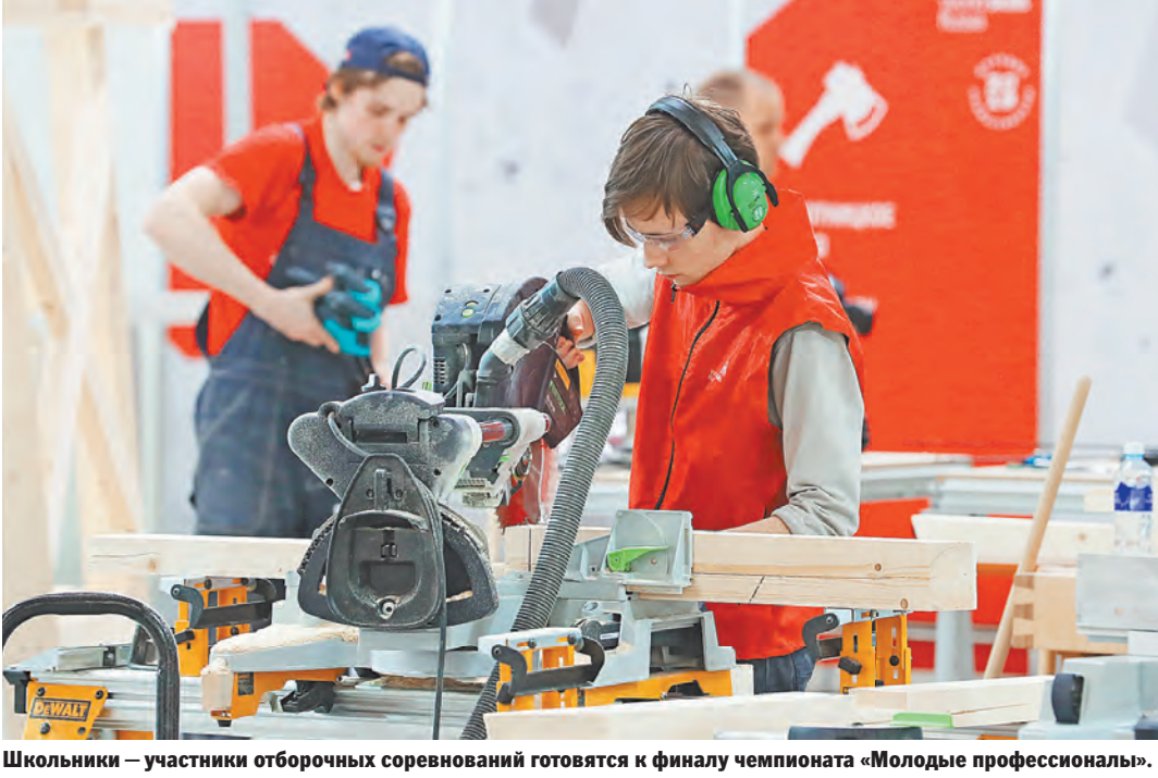
Школьники — участники отборочных соревнований готовятся к финалу чемпионата «Молодые профессионалы».

Глушко. — В этом году конкурс на бюджетные места в столичных учреждениях среднего профессионального образования (СПО) очень серьезный. Поступает больше девятиклассников, а спрос на некоторые специальности оказался даже выше, чем в вузах: более 10 человек на место. На прошлом мировом чемпионате в Абу-Даби наша национальная сборная заняла первое место в общекомандном зачете: завоевала 11 медалей и 21 медальон за профессионализм. Среди топовых компетенций — ювелирное дело, веб-разработка, холодильная техника, экспедиционное грузоперевозки... Причем некоторые наши колледжи — например, Колледж предпринимательства №11 — готовят мировых призеров и чемпионов Европы уже несколько лет подряд.