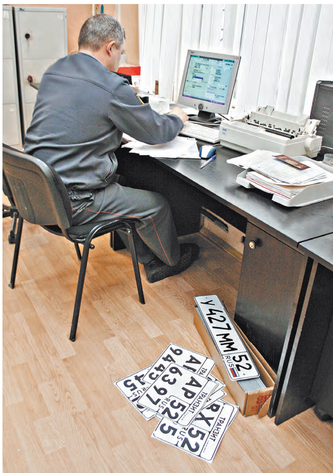
После вступления в силу приказа номера автомобилям будет присваивать компьютер случайным образом. Пока такой способ присвоения номеров работал в качестве эксперимента в Москве.

Менять бумажные паспорта на электронные в обязательном порядке никого не заставят