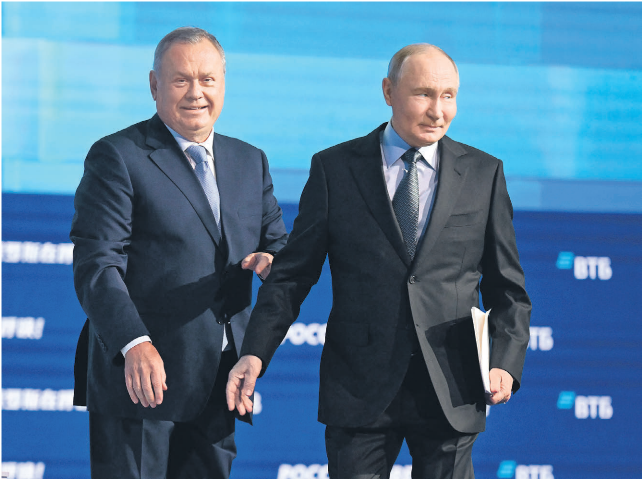
Модератор Андрей Костин и участник дискуссии Владимир Путин на сцене

Но пока ЦМТ (Центр международной торговли), не соответствующий своей аббревиатуре почти последние полвека, как и его помещения для публичных мероприятий с низкими потолками (и с каждым годом, такое впечатление, еще больше снижающимися), снова гостеприимно распахнул свои двери перед участниками форума ВТБ. Зато все привыкли, зато безопасность внутри и снаружи отлажена и на высоте, в отличие от потолков, и снова возникает чувство локтя, от него никуда не деться, и даже, кажется, никто не в обиде. Да, столы