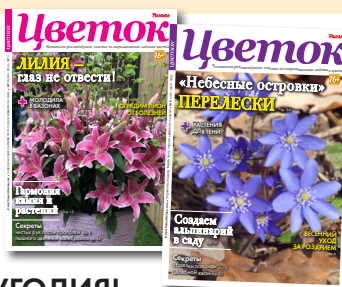
Реклама, УНП 192173221 ООО «Издательский дом «Толока»

ЛИБО ОФОРМЛЯЙТЕ ПОДПИСКУ НА ЛЮБИМЫЙ ЖУРНАЛ С ЛЮБОГО МЕСЯЦА ПО ЕЖЕМЕСЯЧНОМУ ИНДЕКСУ 75079 В ЛЮБОМ ПОЧТОВОМ ОТДЕЛЕНИИ.