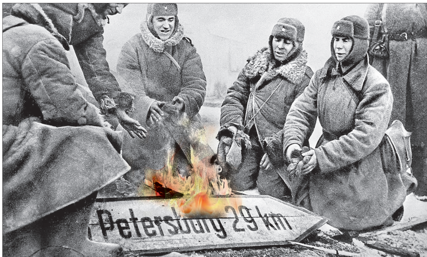
Солдаты Красной армии сжигают немецкий дорожный указатель, 28 января 1944 года

Каждый год, когда приближаются памятные даты, связанные с битвой за Ленинград, блокадой, испытываешь волнение. Трудно снова перечитывать страницы дневников, воспоминаний, писем, слышать голоса умерших мучительной смертью или выживших, но испытавших столько страданий и утрат, что сознание отказывается принимать, сердце отказывается «впускать» стучащую через десятилетия боль... Но если не представлять себе глубину той бездны, куда гитлеровцы стремились столкнуть Ленинград и его жителей, невозможно в полной мере оценить величие