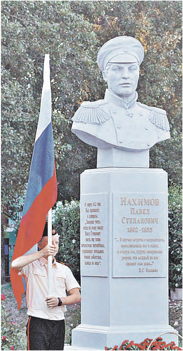
Павел Нахимов защищал Севастополь, а нынешние нахимовцы будут в нем служить.

Суворовцы, нахимовцы, взявшие за руки, поют песню о Беларуси, а небо «взрывается» красочным салютом.