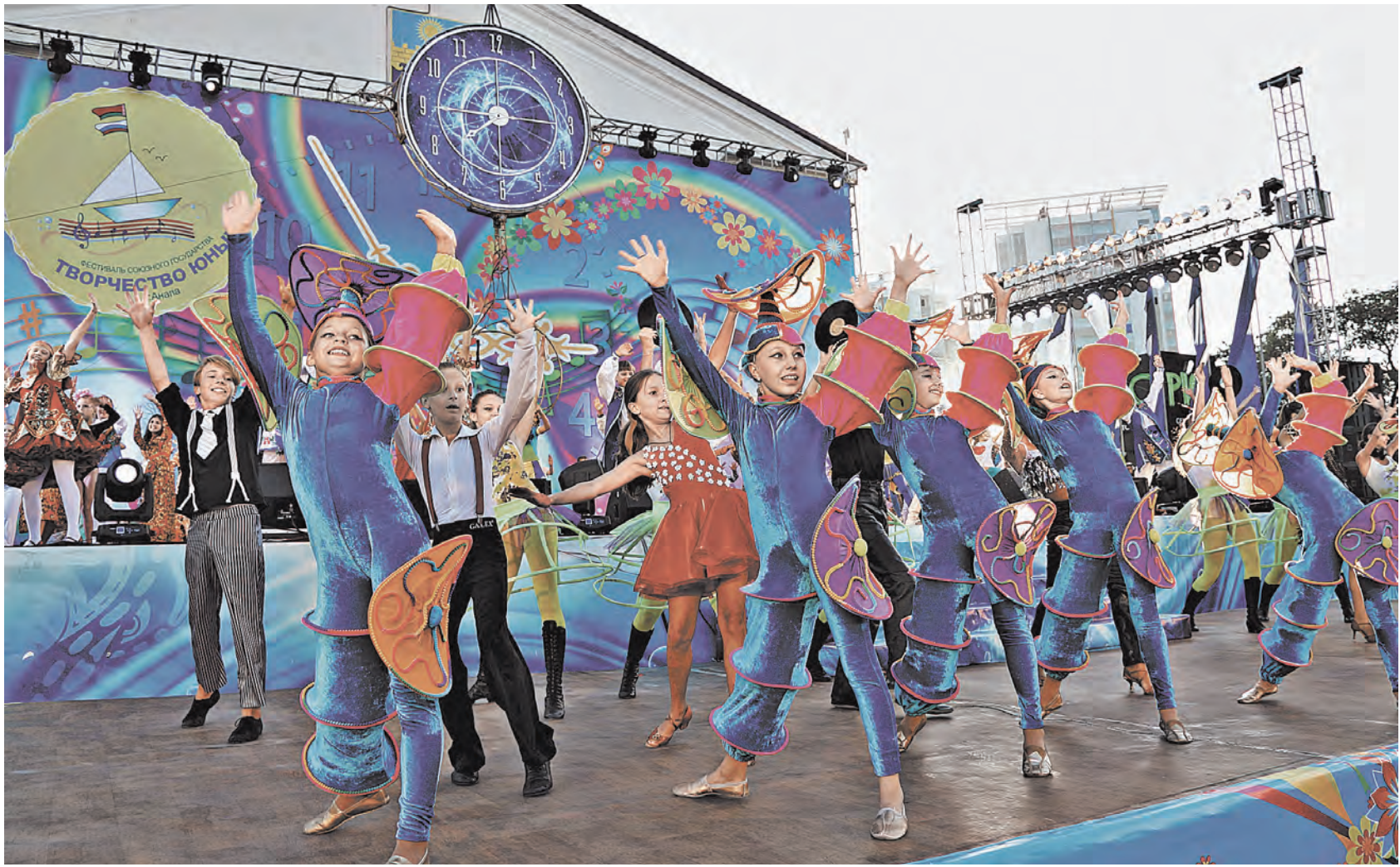
На фестиваль «Творчество юных» съехались победители региональных конкурсов из Беларуси и России — певцы, танцоры, музыканты, хоры. Всего — около 150 исполнителей, которым от 7 до 18 лет.

Кстати, в день открытия изнуряющая двухмесячная жара неожиданно сменилась пасмурной погодой. Местные жители вздохнули с облегчением, а вот гости заворачали. Но буквально за час до концерта-открытия