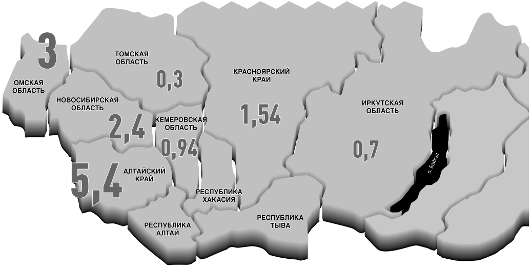
ИНФОРМАЦИЯ: ИГ. / МАКСИМ ИВАНОВ / ЮРИЙ ПРОКОПЬЕВ

Источник: правительства и администрации субъектов РФ